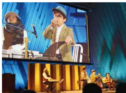
京都地球環境の殿堂 表彰式 (京都国際会館)