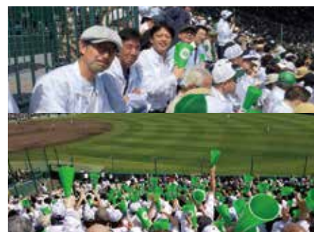
高校野球春の選抜大会 府立乙訓高校の応援