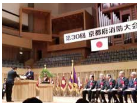
京都府消防大会 (京都コンサートホール)