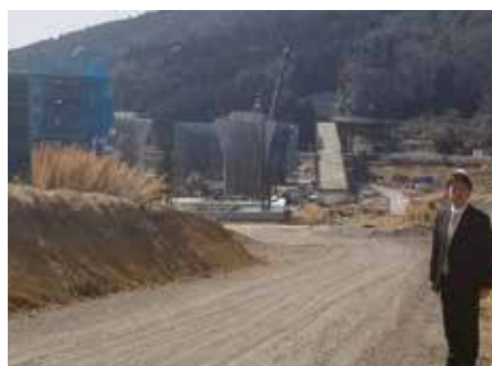
新名神高速道路の工事の様子を視察 (宇治田原町内)