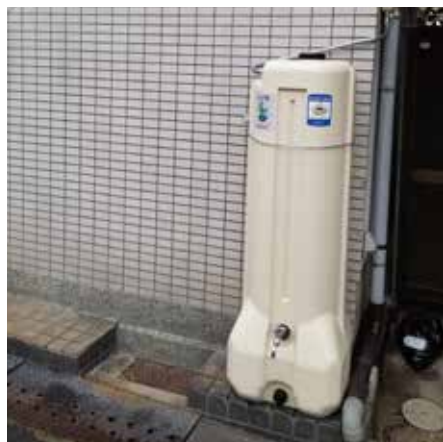
マイクロ呑龍(どんりゅう)を磯野事務所にも設置 雨水をためて有効利用します 府内に1万ヶ所設置目標