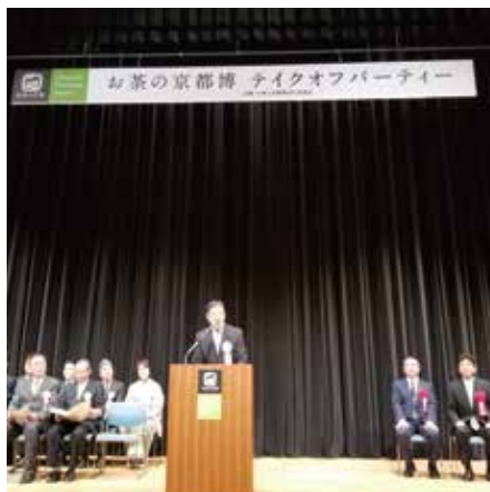
お茶の京都博テイクオフ (アスピーア山城)