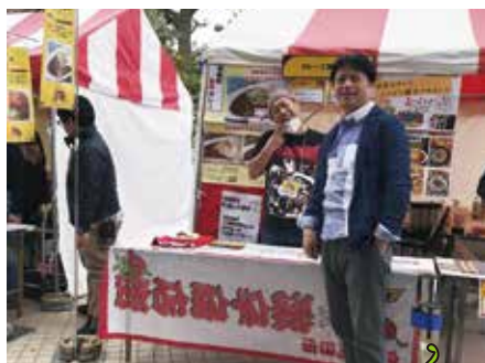
激辛商店街コラボ KBS 京都さんと (竜王アウトレット)