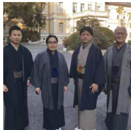
着物振興議員連盟 着物議会開催