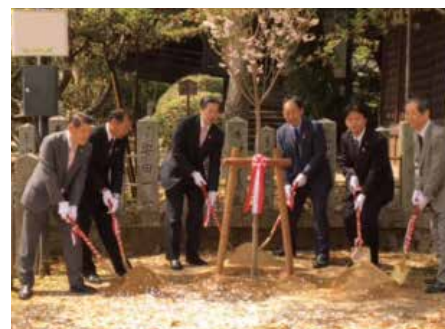
桜祭りで植樹祭 (向日神社)