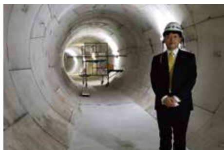
流域下水道の現状を視察 (いろは呑龍トンネル乙訓ポンプ場)