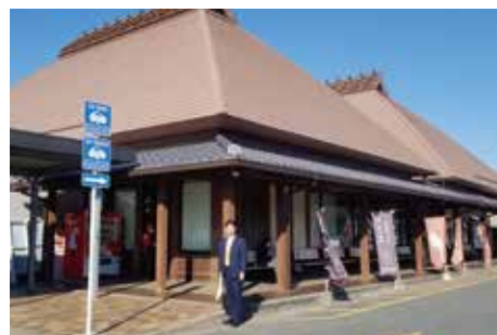
道の駅を核とした観光地域づくりを学 ぶ(福岡県うきは市)