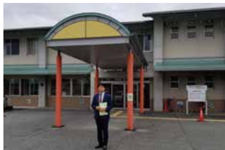
発達障がい児初診待機期間半減事業 (京田辺市・子供発達支援センター)