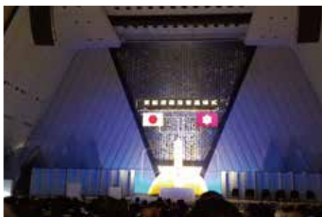
京都府戦没者追悼式に参列