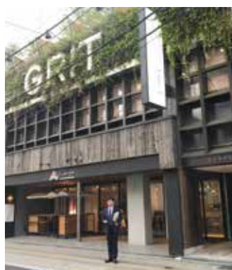
イノベーション立県を目指 した取組み(広島市)