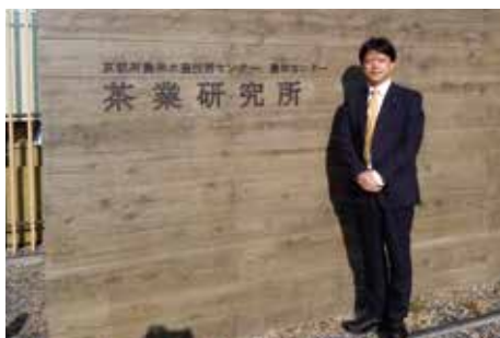
京都府茶業研究所の機能強化事業を学 ぶ(宇治市)