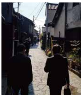
日本遺産を活かした観光振 興を学ぶ(広島県福山市鞆ヶ浦)