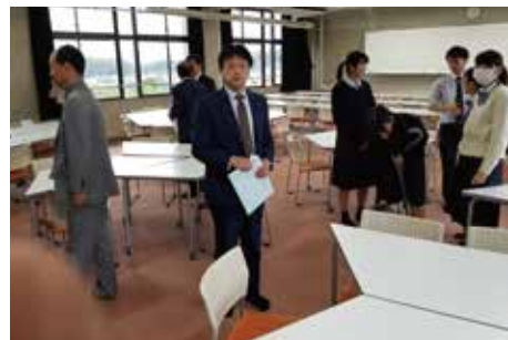
中高一貫公立学校の校舎整備を視察 (木津川市・府立南陽高等学校・附属中学校)