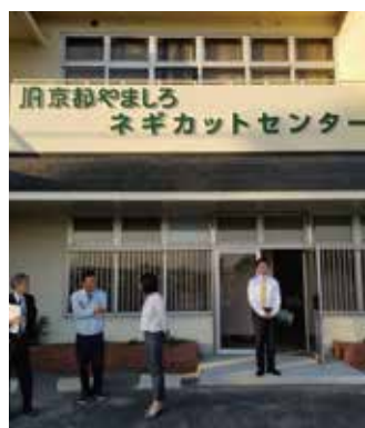
ネギ刻み施設にて農林水産 業の基盤整備を学ぶ (久御山町)