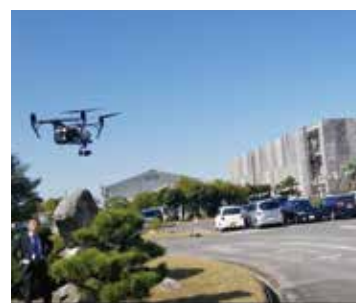
大学・IT企業と連携したス マート農業導入を学ぶ (佐賀県佐賀市農業試験研究センタ ー)