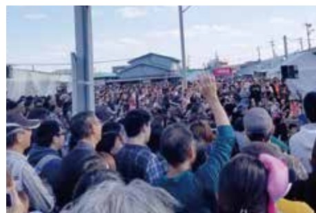
激辛グルメ日本一決定戦 KARA-1 グ ランプリ・大物産展に約 11 万人来 場!(向日町競輪場)