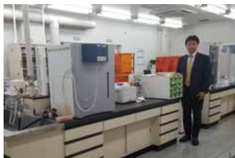
バイオ産業創出事業を学ぶ (福岡県久留米リサーチパーク)